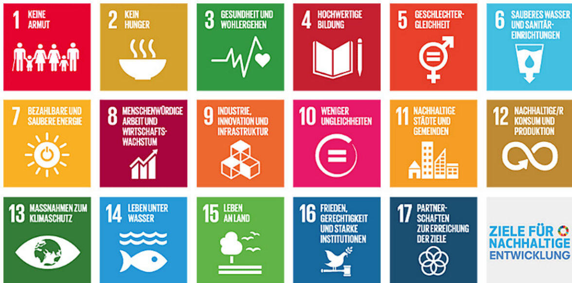
Abbildung 1: Die 17 Sustainable Development Goals 4

Die Agenda 2030 ist der vorläufige Höhepunkt der internationalen Debatte über nachhaltige Entwicklung in allen Dimensionen. „Durch ihre universelle Gültigkeit und aufgrund des ganzheitlichen Entwicklungsansatzes, der die drei Dimensionen Wirtschaft, Soziales und Ökologie gleichrangig berücksichtigt, und dabei auch die Wahrung der Menschenrechte, Rechtsstaatlichkeit, Good Governance, Frieden und Sicherheit einfordert, stellt die Agenda 2030 ein Novum dar.“ 5 Damit stellen die SDGs einen umfassenden, internationalen Orientierungsrahmen der Nachhaltigkeit dar, der mit der „Wahrung der Menschenrechte, Rechtsstaatlichkeit, Good Governance, Frieden und Sicherheit“ auch die politisch-institutionelle Dimension der Nachhaltigkeit beinhaltet als ein Handeln, das zur Weiterentwicklung der Gesellschaft in ihrer demokratischen Verfasstheit beiträgt. Mit der Deutschen Nachhaltigkeitsstrategie hat