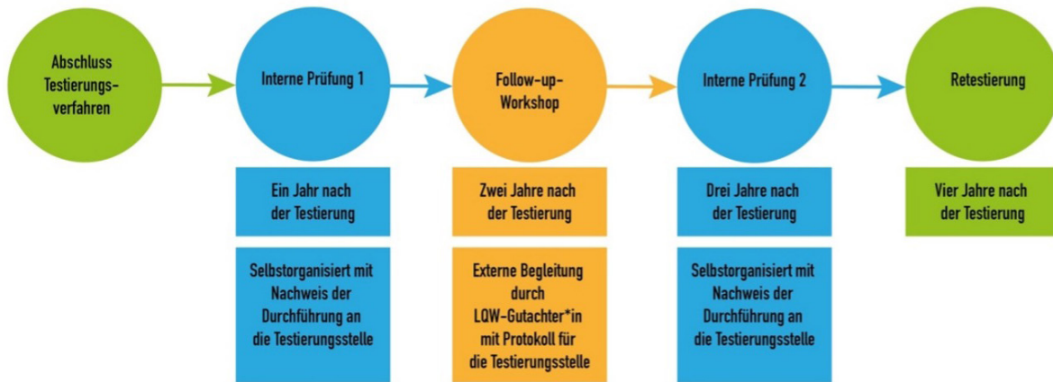
Grafik: con!flex Qualitätstestierung GmbH

Nach dem Abschluss des Testierungsverfahrens werden – wie auf Seite 43f. beschrieben – im Zeitraum bis zur Retestierung zwei interne Prüfungen der Funktionsweise der Organisation sowie ein Follow-up-Workshop durchgeführt: